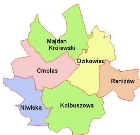
Rys1. Położenie gmin Kolbuszowa i Dzikowiec w granicach powiatu kolbuszowskiego.

Dodatkowe informacje w akapicie dotyczącym zagrożeń niebiotycznych występujących na opracowywanym obszarze.