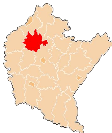
Rys2. Położenie powiatu w granicach województwa podkarpackiego.